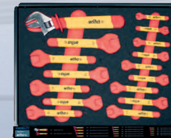
Zestaw kluczy I 6-24