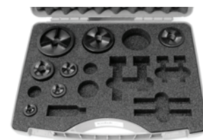
Zestaw M16 - M63 Nr kat. 80007

Samocentryżujące wykrojniki do stali, aluminium oraz plastiku. Wykrojniki dostępne w rozmiarach PG 16, M16 ..... M75 i M85. Można stosować do wszystkich dławnic dzielonych icotek oraz okrągłych przepustów kablowych.