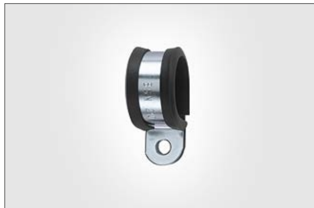
HelaGuard AFCS, Obejma ze stali galwanizowanej z profilem ochronnym z PVC.