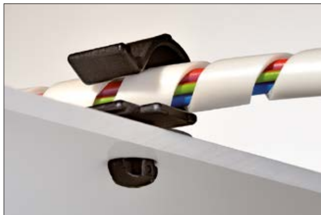
Bardzo wąska główka w kształcie strzały została zaprojektowana tak, by idealnie pasowała do małych otworów montażowych.