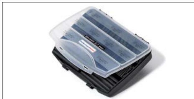
ShrinkKit 321 Basic.